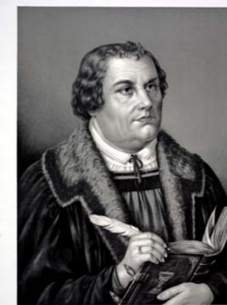
DR. MARTIN LUTHER.

Martín Lutero sólo pasó unos diez días en Worms, pero esos diez días cambiarían básicamente el mundo. Más bien al margen, el monje agustino de Wittenberg fue convocado a comparecer ante la Dieta Imperial, que se inició en enero de 1521, pues llevaba tiempo generando intranquilidad. Exhortando la vuelta a los orígenes de la creencia cristiana, este monje decía exactamente lo que pensaba a muchos de sus coetáneos. Si embargo, sus opositores consideraron sus escritos como un claro desafío a Roma y como una rebelión contra la autoridad, por lo que Lutero se vio obligado a distanciarse de lo que había escrito, implorando tiempo para reflexionar para finalmente declararse intransigente. Si no podía retractarse mediante el testimonio de las Sagradas Escrituras, las cuales había adoptado como guía, entonces es que no podía ni quería hacerlo, "porque hacer algo en contra de la conciencia no es seguro ni saludable".