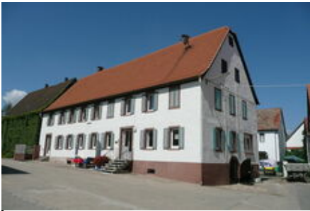
Hof Schäfer in Ibersheim - über 300 Jahre Geschichte

Inmitten der Denkmalzone des Ortes liegt an der Nordostseite der bereits 300 Jahre alte stattliche Bauernhof. Wer diese lange Zeit einmal nachvollziehen lässt, erhält erstaunliche Informationen. Im Fuchseck 3 werden erst das beeindruckende Wohnhaus und dahinter die besonders großen Scheunen sichtbar.