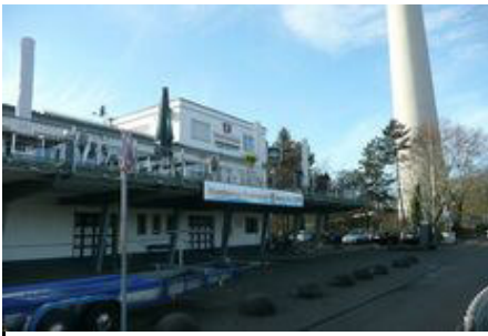
Die (neue) Mannheimer Heimat des "kleinen Wormser Hagens": der Ruderverein Amicitia