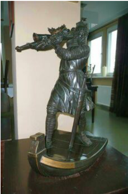
Hagendenkmal als Miniaturausgabe

Die Stadt Worms ist stolz auf ihre Nibelungen, jedoch weniger stolz darauf, dass Hagen deren Schatz im Rhein versenkt hat. Noch schlimmer ist, dass er bis heute noch nicht gefunden wurde, obwohl die Stadt manchmal einen Goldschatz gebrauchen könnte.